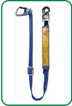
Verbindungsmittel mit Bandfalldämpfer

einstellbar bis 1,80 m gem. DIN EN 354 + 355 + DIN 19427