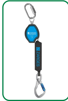
Höhensicherungs- gerät Aethor 1.8

Seilzug bis 1,80 m gem. DIN EN 360 + DIN 19427