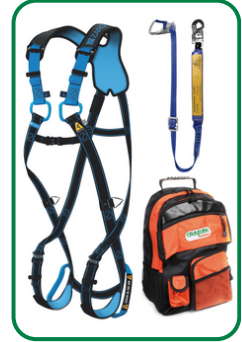
Set 2 - Komfort Auffanggurt Salvex+, Verbindungsmittel mit BFD, Rucksack